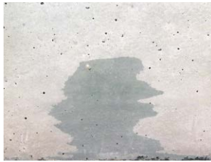
Grünlich-blaue Färbung einer Betonoberfläche drei Tage nach dem Ausschalen

Bei der Verwendung hütten-sandhaltiger Zemente CEM II-S (Portlandhütten-zement) und CEM III (Hoch-ofenzement) können vor-übergehend grünlich-blaue Färbungen der frisch aus-geschalteten Betonoberfläche auftreten. Diese Färbung geht aber meist schon nach wenigen Tagen in das übliche helle Grau einer Betonoberfläche über.