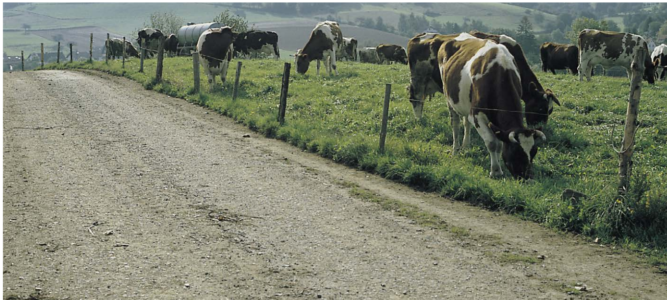
Bild 9: Naturnaher Weg mit hydraulisch gebundener Tragdeckschicht (HGTD)

draulikkvorrichtungen an Kleinbaggern gefasst, vor Kopf auf das vorbereitete Planum abgesetzt und anschließend gerichtet und eingerüttelt (Bild 4). Die übliche Steindicke beträgt 8 cm. Eine grobporenreiche Tragschicht kann die Wasserdurchlässigkeit des gepflasterten Weges zusätzlich verbessern.