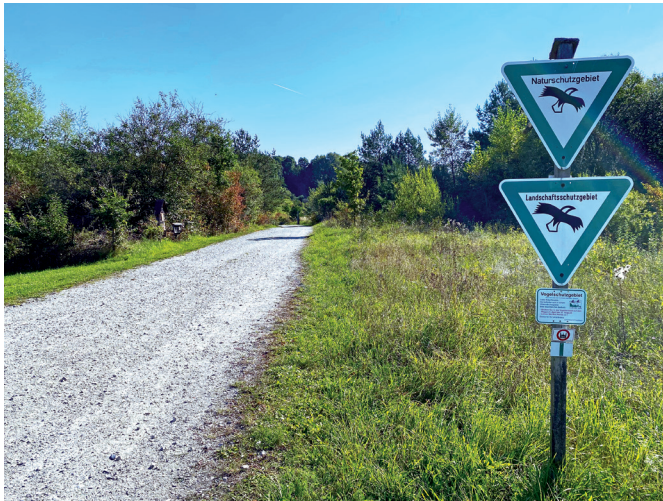
Bild 5: Blick in eine renaturierte Lias-Grube (Liapor GmbH & Co. KG)

Blähton und Blähglas sind ungiftig und schadstofffrei und sind nach der DIN EN 13055-1 [15] genormte Leichtbaustoffe und mit dem Blauen Engel ausgezeichnet. Lagerstätten von Ton werden nach Nutzungsende renaturiert und der Bevölkerung für Naherholung zurückgegeben (Bild 5) oder stehen dem Naturschutz zur Verfügung [16]. Des Weiteren besteht Blähglas aus 100 % recyceltem Glas.